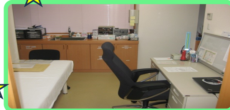
隣接する老健の中に診療所を開設！！月2回の訪問診療と診療所での受診も可能！！医療体制も整え、健康面もこれで大丈夫！！