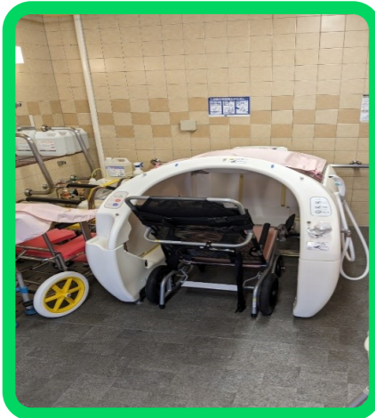
ファインミラフル搭載したごすい洗いのいらない車いすごと入れるお風呂「ARAERU」