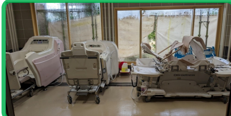
最新座浴2台と特浴1台導入。気持ちよく入浴出来ます！