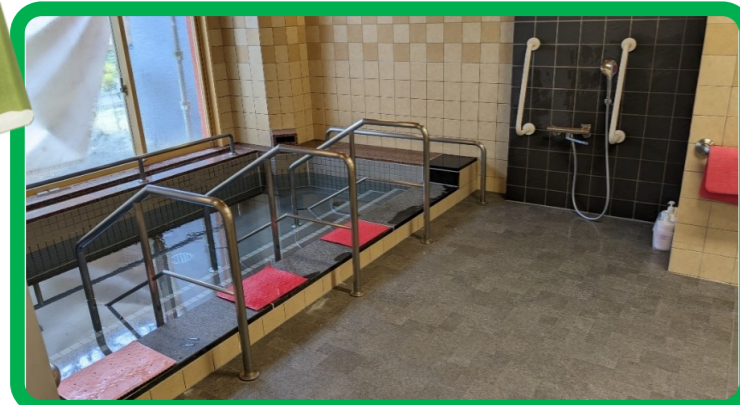
一般浴も改装！手すりも付けてより安全に安心して入浴出来ます！